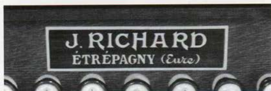
11 - Harmonium « modern' style », vers 1920, fabriqué par J. Richard à Etrépagny, coll. part.